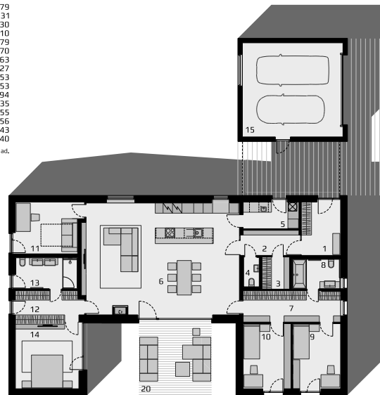
DISPOZICE RD D|E